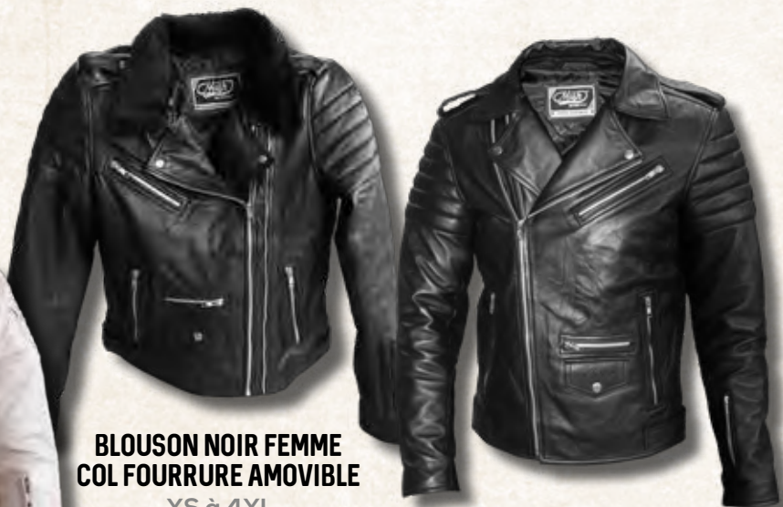
BLOUSON NOIR FEMME COL FOURRURE AMOVIBLE XS à 4XL