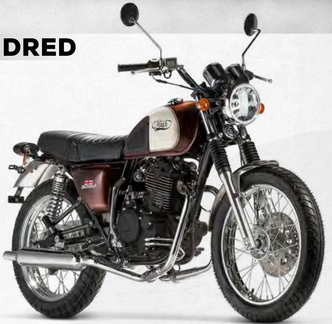
FIVE HUNDRED ● BROWN