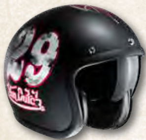
CASQUES VON DUTCH COULEUR AU CHOIX XS à XXL