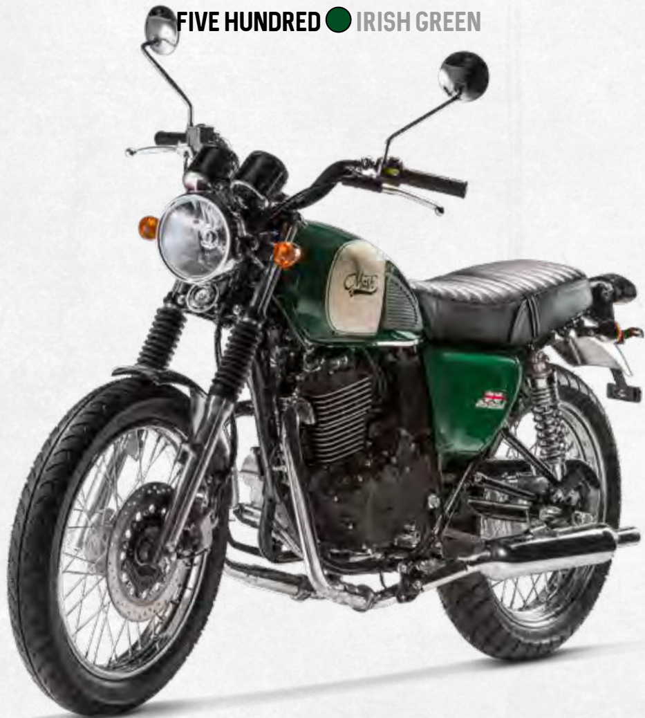
FIVE HUNDRED ● IRISH GREEN