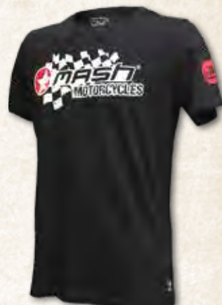
T-SHIRT HOMME « MASH MOTORCYCLES » S à 3 XL