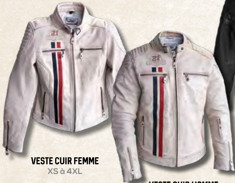
VESTE CUIR FEMME XS à 4XL