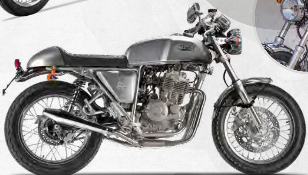
TT40 NAKED ● CANDY RED ● BLACK ● SILVER GREY