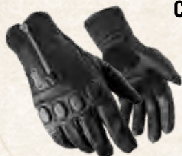
GANTS CUIR NOIR XS à 3XL